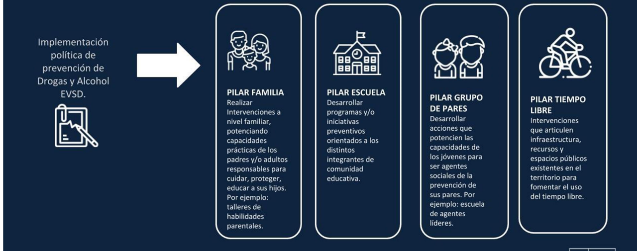
Figura N°2: Papel del equipo Senda PREVIENE en el territorio.